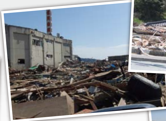
東日本大震災 Great East Japan Earthquake Grande Terremoto do Leste do Japão 东日本特大地震灾害

1995年1月17日 In Jan, 17th 1995. Dia 17 de janeiro de 1995