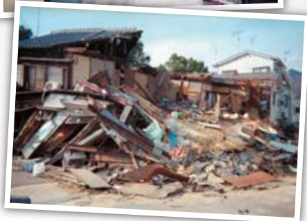
阪神・淡路大震災 Hanshin-Awaji Earthquake O grande terremoto Hanshin Awaji 阪神・淡路大地震

1995年1月17日 In Jan, 17th 1995. Dia 17 de janeiro de 1995