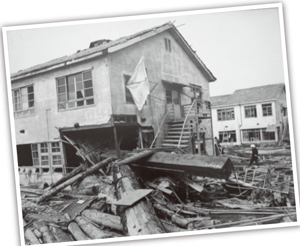
伊勢湾台風 Isewan typhoon Isewantaifu 伊势湾台风 1959年9月26日 In Sep, 26th 1959. Dia 26 de setembro de 1959

Major storm and flood damage in Aichi Pref. Principais danos causados por ventos e inundações na província de Aichi 爱知县的主要风灾与水灾