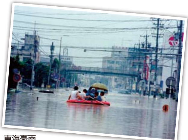
東海豪雨 Heavy Rainfall Disaster in Tokai Area Chuva torrencial de Tokai. "Tokaigouu" 东海暴雨 2000年9月11～12日 From Sep. 11th to 12th, 2000. Dia 11 ao dia 12 de setembro de 2000