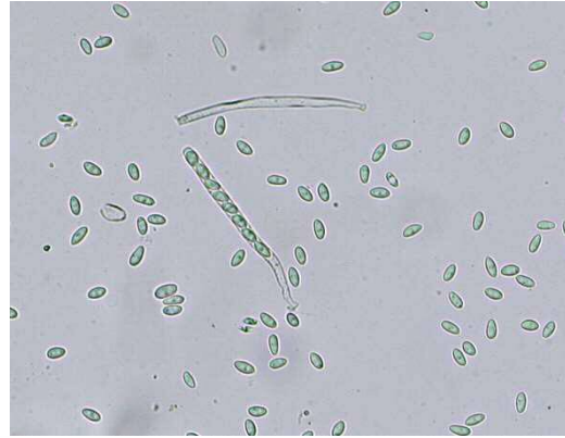
子のう胞子と胞子

きのこの傘の直径は3mm～5mm、非常に小さい きのこから子のう胞子が飛び、感染源となる