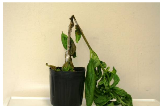
菌核病菌を接種したバジル