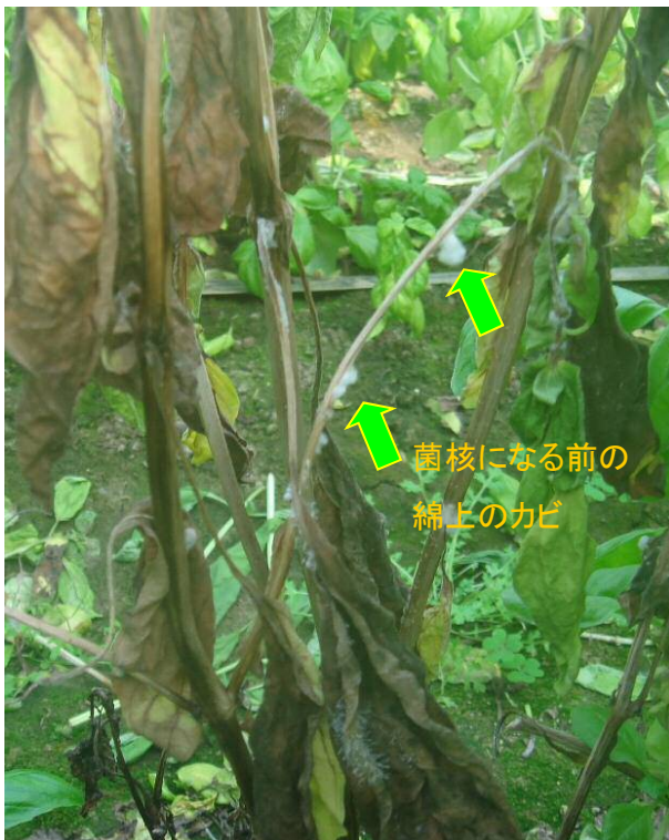
菌核病により枯れたバジル。最初は白い菌糸の塊ができ、後に黒いネズミの糞状の菌核となる