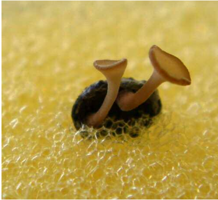
菌核から生えたきのこ(子のう盤)

きのこの傘の直径は3mm～5mm、非常に小さい きのこから子のう胞子が飛び、感染源となる