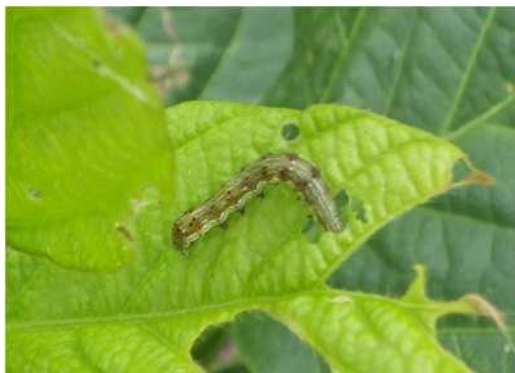
図2 オオタバコガ幼虫と被害葉(ダイズ)

IRACコードの詳細は、 https://www.jcpa.or.jp/labo/pdf/2018/mechanism_irac03.pdf を参照する。農薬の散布に当たっては、ラベルの表示事項を守るとともに、他の作物や周辺環境への飛散防止に努めましょう。