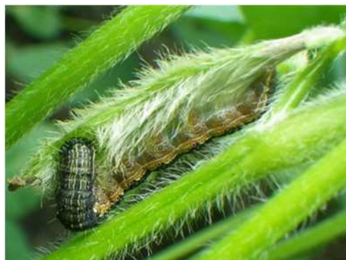
図3 莢(ダイズ)を加害する老齢幼虫