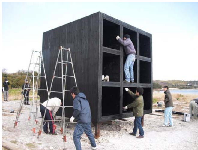
おひるねハウスの手入れ

佐久島固有の資源を発掘・研鑽し、島の活性化を推進することを目的として設立。「アートによる島おこし」が基軸となり、「ひと里」、「美食」、「漁師」、「いにしえ」の4つの分科会を核に、島民が主体となって、梅園の手入れ、黒壁による景観形成、藻場の再生、太鼓フェスティバルなど島おこし活動を行っている。