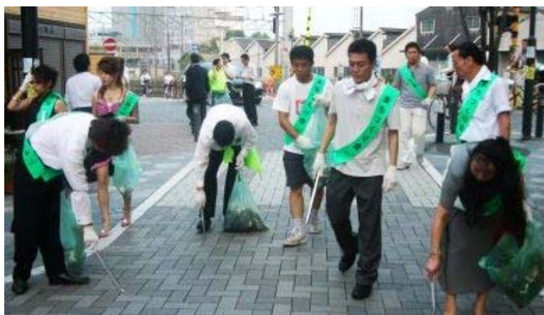
花と蝶のパトロール