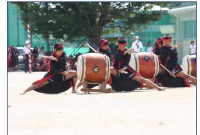
岡崎市立南中学校

先生といっしょに作詞作曲したり、プロの和太鼓チームに教えてもらったりしながら、学年みんなで練習を重ね、体育大会で家族や地域の人にも見てもらいました。