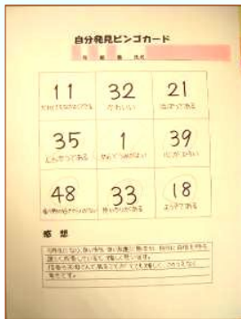
春日井市立高座小学校

おうちの人に、数字と、わたしの良いところを9つ選んで書いてもらったカードで、ビンゴゲームをしました。