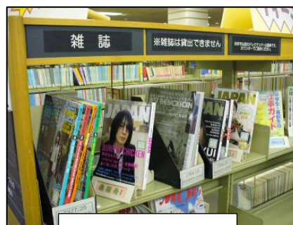
ティーンズコーナー

また、充実したサービスを継続するために、青少年サービスに必要な知識を有する職員の養成をめざします。