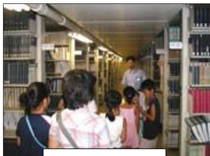
図書館探検ツアー

県図書館では小学生、中学生向けに普段見ることができない書庫や仕事場など図書館のバックステージを案内する「図書館探検ツアー」を実施しています。図書館の役立つ機能を積極的にPRすることにより、図書館を子どもたちのより身近な存在として意識付けるよう努めます。