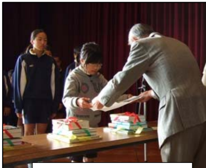
小学校での図書寄贈式

家庭、地域、学校で「青少年によい本をすすめる県民運動」を毎年10月に展開し、青少年健全育成の観点からも、子どもの読書活動の推進を図ります。