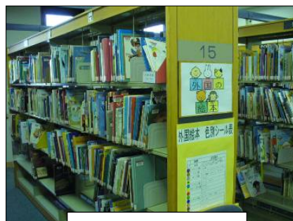
児童図書室 洋書架