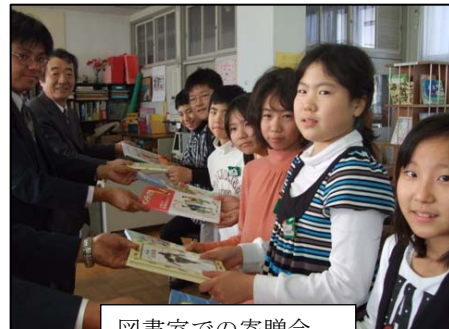
図書室での寄贈会