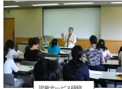
児童サービス研修

県域を活動範囲とする※31 愛知図書館協会や※32 愛知県公立図書館長協議会と連携し、市町村立図書館で子どもへのサービスに携わる職員等を対象にした研修の充実に努め、子どもの読書活動推進を進める職員等の育成を図ります。