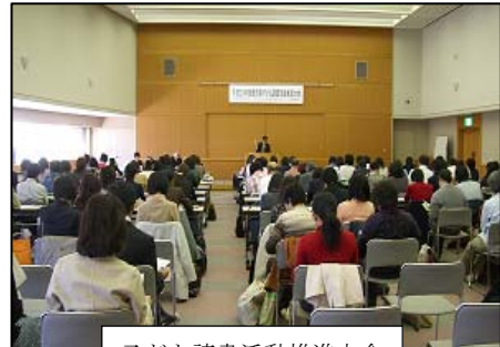
子ども読書活動推進大会

※15 「子ども読書活動推進大会」等の事業を積極的に行うことで、研修の場を提供し、指導的なボランティアの育成を図ります。