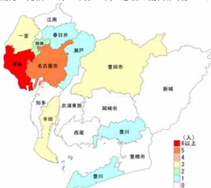
図 麻疹・成人麻疹患者保健所別発生分布図 (「麻疹全数把握事業」による)

麻疹ウイルスの感染力は非常に強いですが、予防手段としてワクチンが有効です。現在麻疹に未罹患でワクチン未接種者へのワクチン接種は非常に重要ですので、かかりつけ医と相談し予防接種計画を立てることをおすすめします。なお、予防接種法に基づく定期接種として麻疹風疹混合(MR)ワクチン(または麻疹単抗原ワクチン)の 2 回接種が行われています。1 回目は 1 歳から 2 歳未満、2 回目は小学校就学前の 1 年間(いわゆる年長児のとき)です。