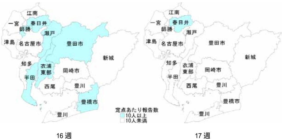
図 定点あたり患者報告数(保健所別)

インフルエンザウイルス分離状況 http://www.pref.aichi.jp/eiseiken/67f/infbunri06_07.html