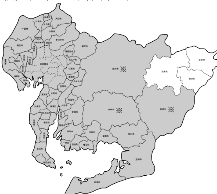
(図) 市町村別の規制対象地域