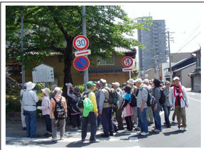
⑪大イチョウを見学中です。