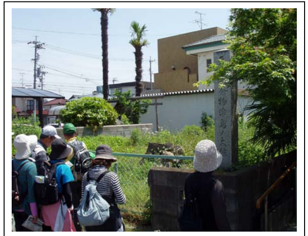
⑩津島の大掠（ムク）※切られてました。