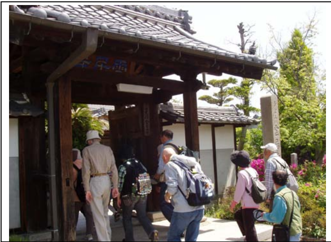
⑨雲居寺に到着しました。