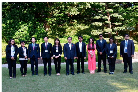
【愛知のものづくりを支える留学生（第3期生）】