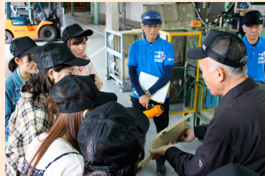
県内の製瓦企業で瓦の製造工程を学ぶ学生

愛知県立大学が、「グローバル実践教育事業」の一環として実施している「地域ものづくり学生共同プロジェクト」は、学生が県内モノづくり企業と連携し、その企業の製品の製造過程や歴史などを学びながら、英語・中国語など多言語でPR（広報物）を作成する取組です。このような産学連携による取組は、言語だけでなく、グローバル人材に必要な課題解決能力や、異文化の人々と協力してプロジェクトを遂行する能力の養成にもつながっています。