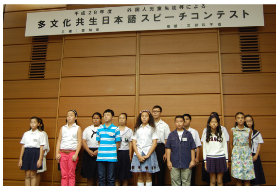
【多文化共生日本語スピーチコンテスト（2016年8月）】