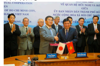
ホーチミン市（ベトナム）との覚書締結