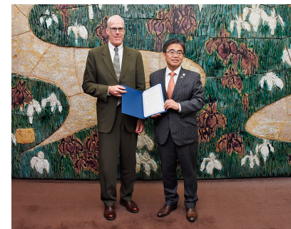
ワシントン州（アメリカ）との覚書締結