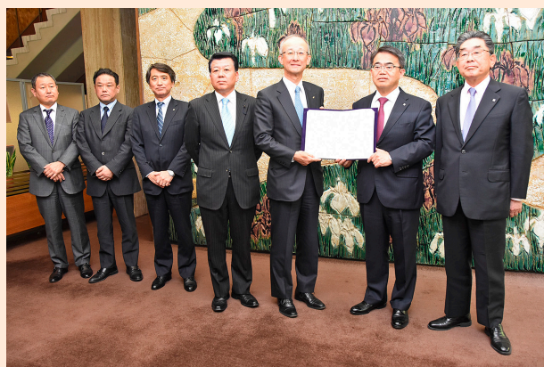
協定の締結 (2017年4月18日)

そこで、2017年4月、海外に幅広いネットワークを有し、アジア地域で多くの進出企業向けの工業団地を運営する、豊田通商株式会社と連携協定を締結しました。この協定に基づき、海外進出する県内企業に対し、現地ビジネス環境、インフラ整備状況、輸出入等に係る情報提供や、販路拡大、人事・労務等に関する相談対応など、実務面での具体的な支援を行っていきます。