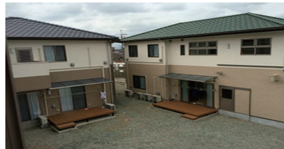
小規模グループケア化のための改築を行った児童養護施設

できる限り家庭的な環境の中で、きめ細かなケア（養育）を提供していくため、児童養護施設や乳児院において、本体施設の小規模グループケア化やグループホームの設置を推進しています。右の写真は、小規模グループケア化のための改築を行った児童養護施設です。