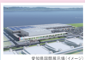
愛知県国際展示場（イメージ）