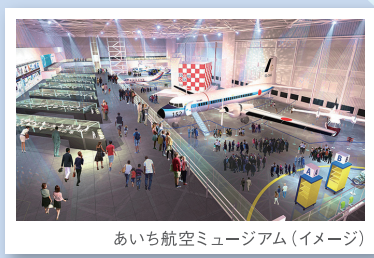
あいち航空ミュージアム（イメージ）