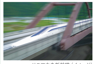
リニア中央新幹線（イメージ）