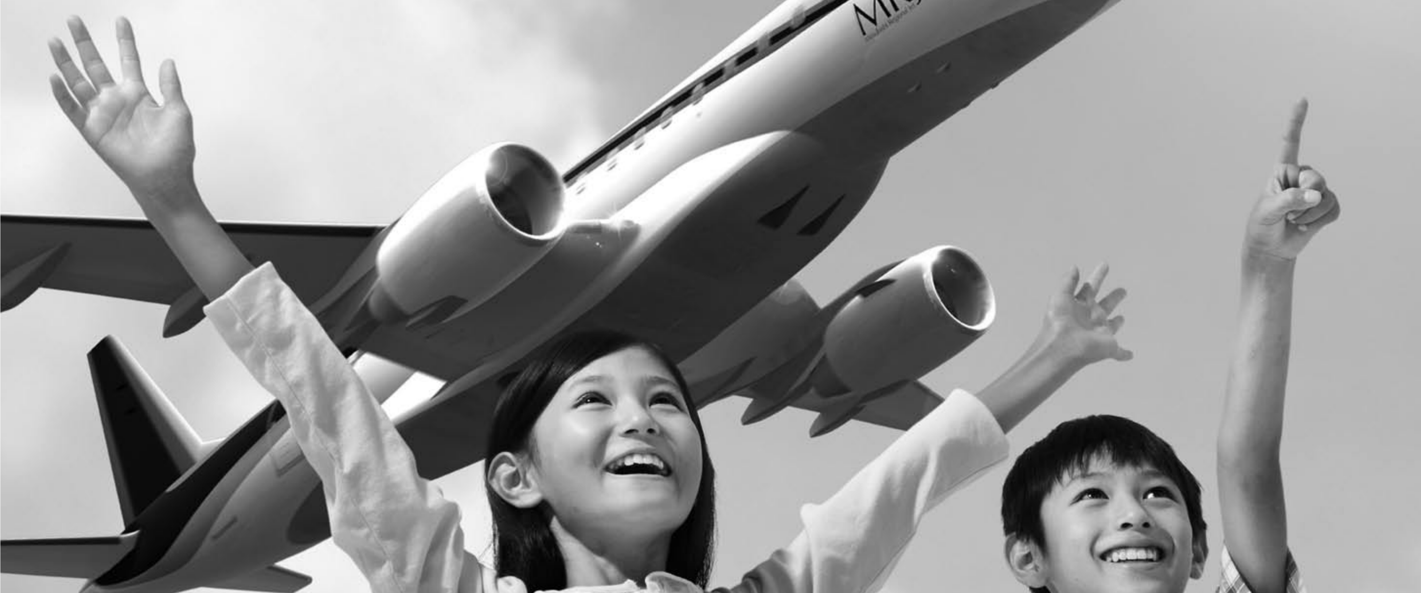
MRJ(三菱リージョナルジェット)のイメージ フライング・ボックス 中央翼 前脚部位 主翼固定後部 主脚格納部