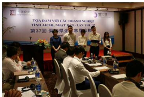
(帰国実習生からの発表)