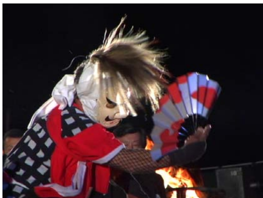
三宅流『究竟の地－岩崎鬼剣舞の一年』2007年

岩手県北上市岩崎に伝わる民俗芸能「岩崎鬼剣舞」を取材したドキュメンタリー。鬼剣舞にたずさわる人々、この地域に生きる人々の姿を一年間に渡って捉えている。鬼剣舞は、農業や大工、あるいはサラリーマンとして勤めるなど、仕事をしながら、その合間をぬって皆で集まり練習を重ね、公演を行っている。また保育園や小学生では授業の一環として、また高校生では部活動としても行われるなど、あらゆる世代に浸透し、あたかもこの地域では生活と芸能が渾然一体となった様相を呈している。この映像作品により、東北地方の風土が育んできた独自の文化の豊かさに触れ、復興への誓いを確かめ合う機会としたい。