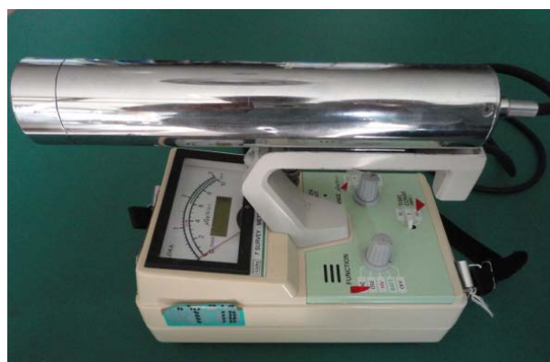
シンチレーションサーベイメータ