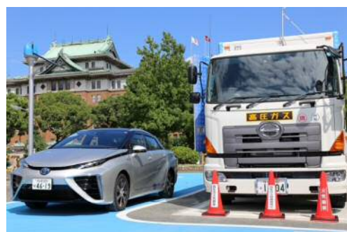
（愛知県庁移動式水素ステーション）

問 合 先：事業所の所在する市町村担当課 又は 愛知県産業労働部産業科学技術課 新エネルギー産業グループ 担当：永田 〒460-8501 名古屋市中区三の丸3-1-2 電話：052-954-6350 Fax：052-954-6977