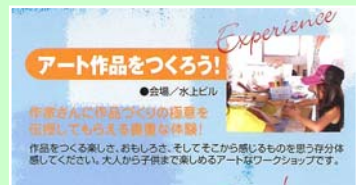
↑アートは難しいと思っているあなたにお勧め