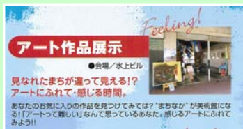
↑イベント時はまちなかが美術館に変身