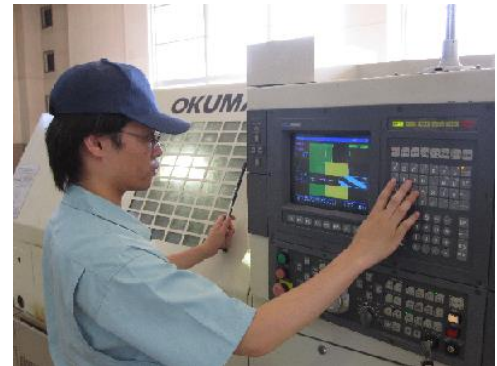
NC工作機械加工実習