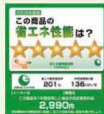
〈統一省エネラベルの例〉

テレビについては、現在90%以上がエコポイントの対象となる「統一省エネラベル」が四つ星以上の商品ですが、経済産業省は現行の省エネ基準を強化し、エネルギー消費効率に現在より37%厳しい新基準を適用することを決定しました。このため、対象となる商品が今後激減する可能性があります。(冷蔵庫とエアコンについては、基準の変更はありません。)