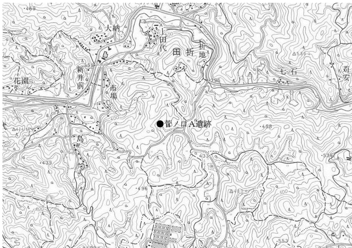
国土地理院 1/2.5 万 地形図「東大沼」