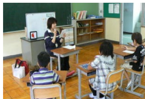
チャレンジルームの授業の様子

認知度を高め、誤解や先入観を取り除くため、全保護者に案内文を配付した。また、児童に対しても、学年に応じて分かりやすく説明した。その結果、チャレンジルームに通う児童は後ろめたさや恥ずかしさがなくなり、級友からも温かく見守ってもらえる関係になっていった。保護者も理解が深まり、利用を希望するようになった。