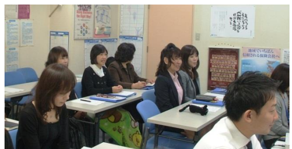
講演に聴き入っている参加者の皆さん

「大地の力、身体力、倫理の力、均衡の力、連帯の力」も強く印象に残った講演でした。