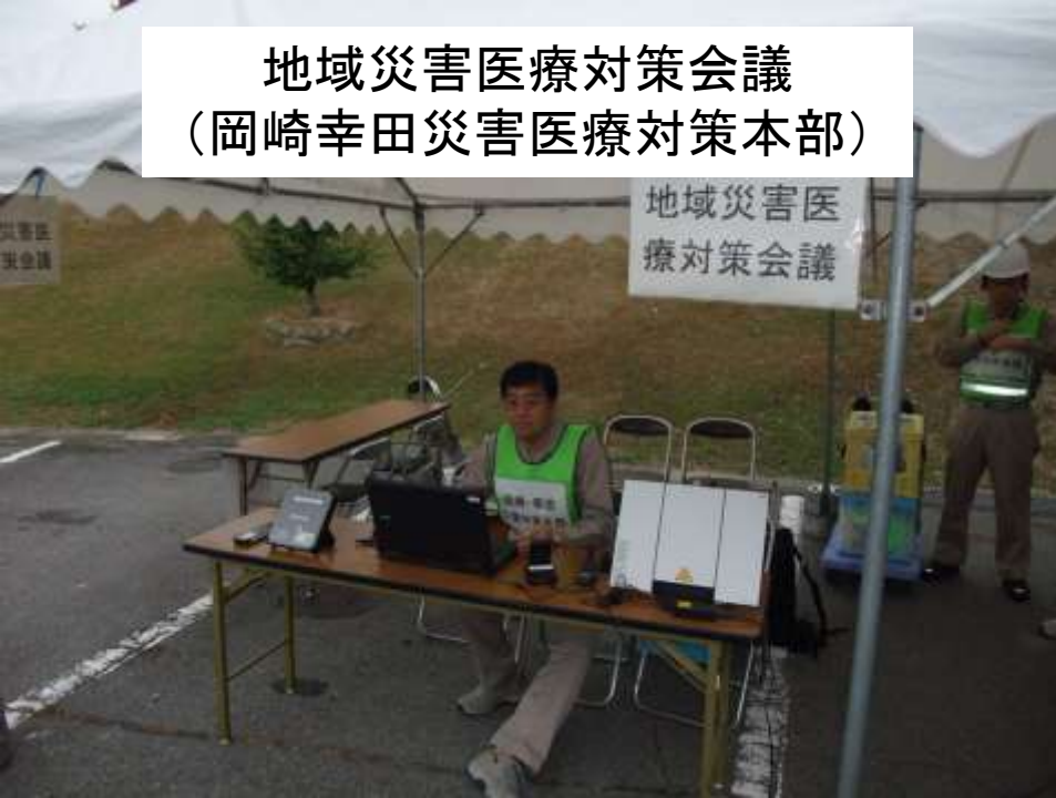
地域災害医療対策会議 (岡崎幸田災害医療対策本部)