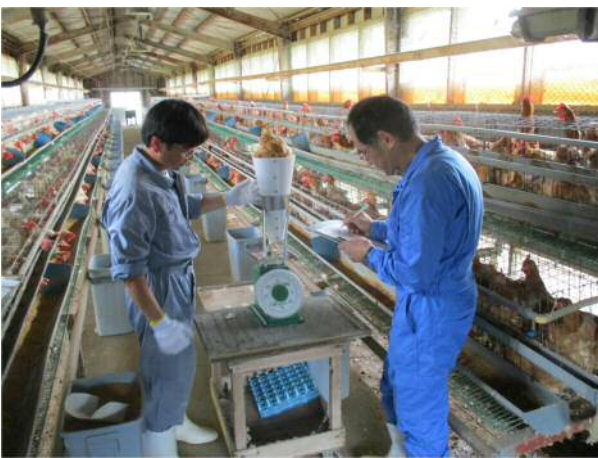
開放型ケージ鶏舎：開設当初から飼養試験に使用し続けている。(平成 28 年)