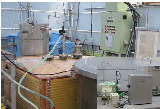
共同研究実施中の小型メタン発酵装置とA社製ガスエンジン (平成 28 年)