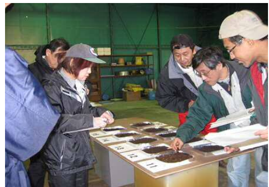
堆肥共励会での審査風景 (平成 23 年)