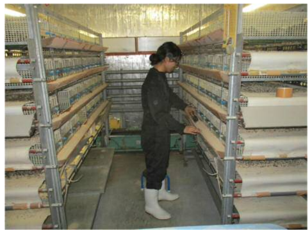
ウズラ系統造成鶏舎：全国初のウズラ育種改良施設。(平成 28 年)