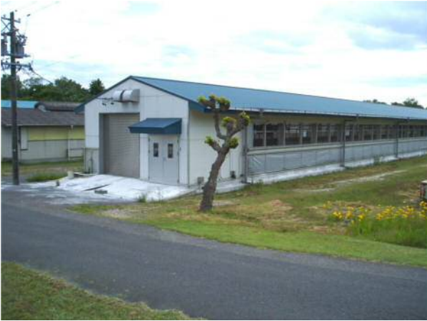
系統造成鶏舎：肉用名古屋コーチン開発のためケージの大型化を図った。(平成 28 年)