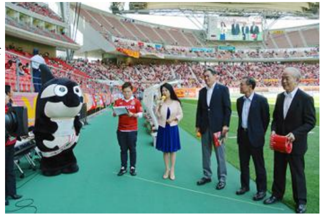
名古屋グランパスの試合前にPRしました

全国健康保険協会愛知支部 支部長 愛知県国民健康保険団体連合会 事務局長 健康保険組合連合会愛知連合会 会長 愛知県副知事 (写真右より)