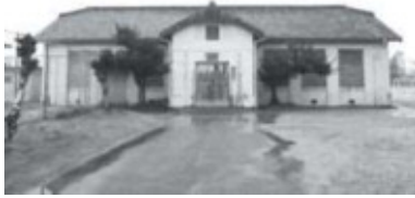
七中記念館外観(西から)

愛知県立半田高等学校は、半田市中央部の出口町、名鉄河和線住吉町駅の西350mに位置し、前身が大正8年(1919)に愛知県立第七中学校として開校した県内有数の伝統校です。