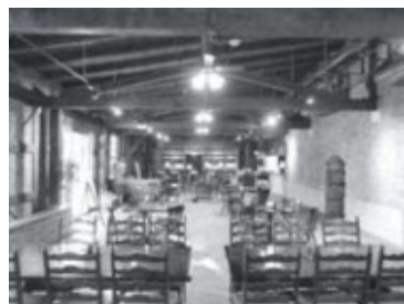
ハーフティンバー棟1階内部(カフェ)