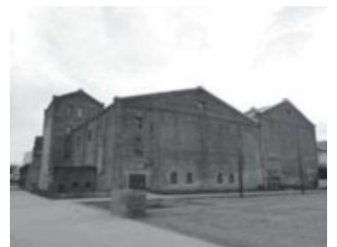
創建時主棟と貯蔵庫外観(北東から)