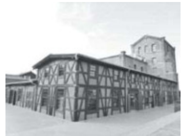
ハーフティンバー棟外観(南東から)