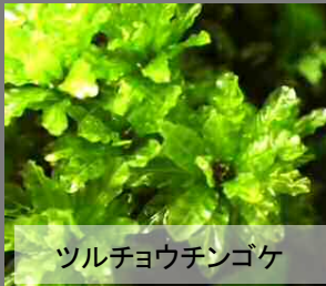
ツルチョウチンゴケ