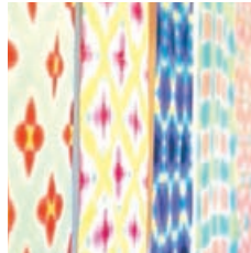
# ARIMATSU SHIBORI Name:yuu