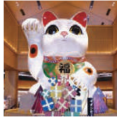
# AEON MALL TOKONAME Name:たつや