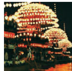
#TSUSHIMA TENNO MATSURI Name:マッキー