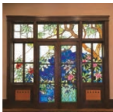
#CULTURAL PATH FUTABA MUSEUM Name:竹内まつみ