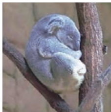
#HIGASHIYAMA ZOO AND BOTANICAL GARDENS Name:mittsu