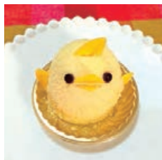
#PIYORIN CHICK Name:sayo