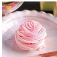
#HANDA SHOKADO CONFECTIONERY Name:Aichi Now