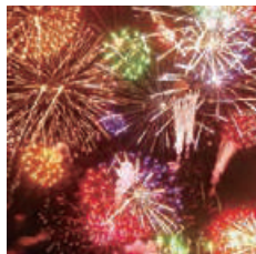
#PORT OF NAGOYA FIREWORKS Name:Mi