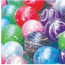
# BISA! MATSURI Name:ノリ