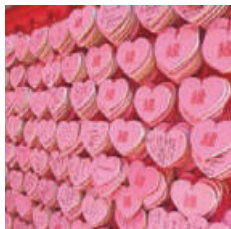
#SANKO INARI SHRINE Name:yokochan