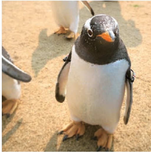
#PORT OF NAGOYA PUBLIC AQUARIUM Name:タク