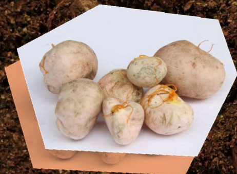
ウスベニタマタケ

高級食材の“トリュフ”が身近な場所に？ 海岸の松林に発生することで有名な“松露”は山の中にも？？ 今回はあまり知られていない地中のキノコ 「地下生菌」についてご紹介します。