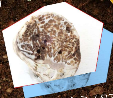
ホシミノタマタケ

地中に広がるきのこの世界。 落ち葉の下を1日探したって 見つからないことも。 それはまるで宝探し！