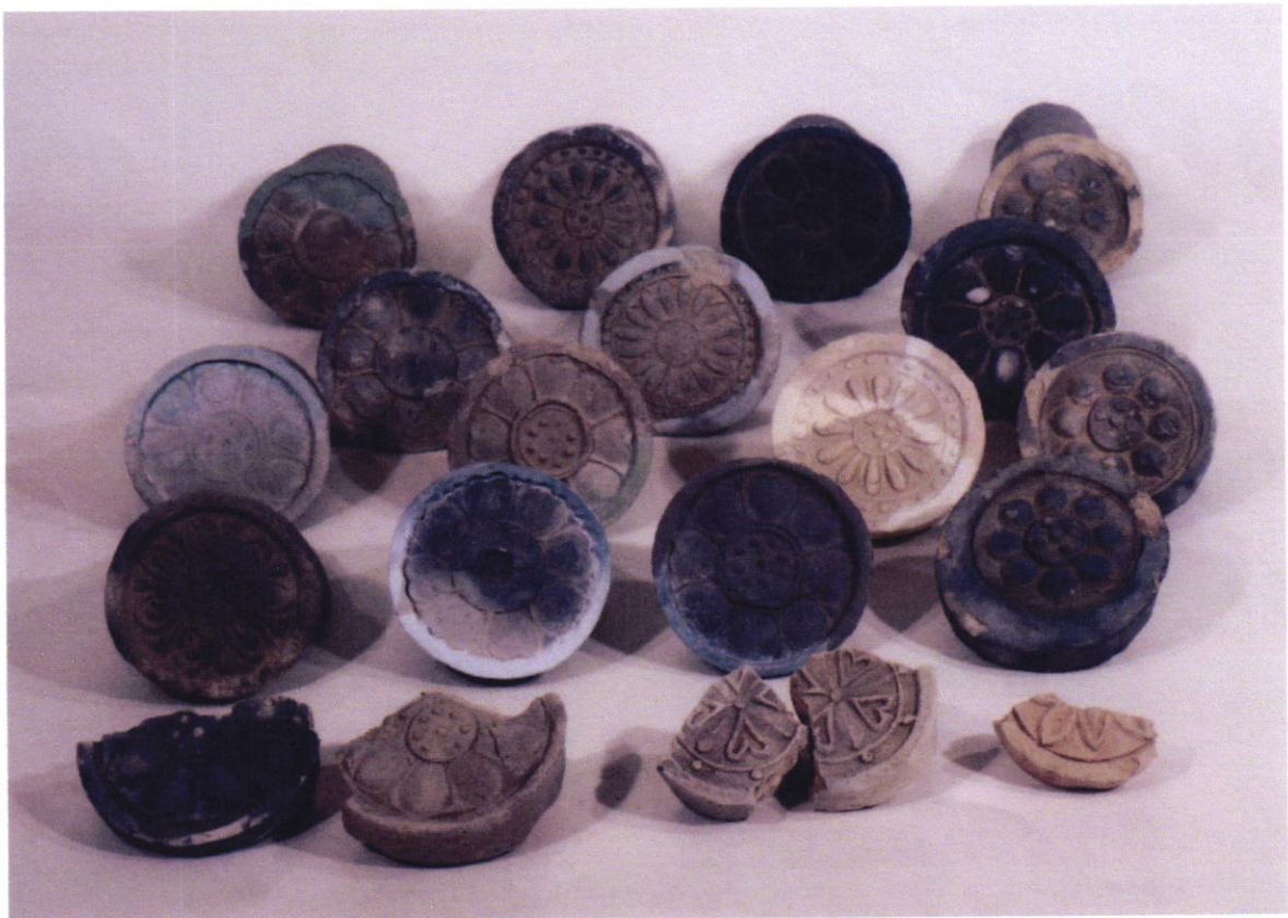
尾張国分寺跡出土軒瓦