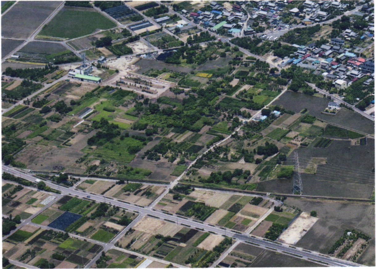
尾張国分寺跡全景