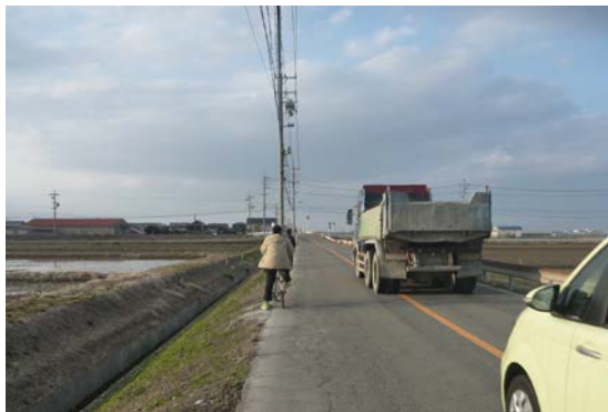
幅員が狭い道路の解消