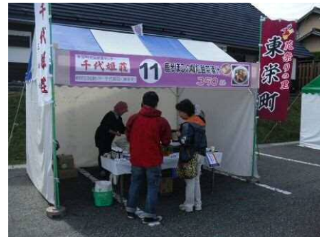
東栄町交流促進センター 千代姫荘