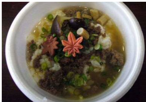
鹿そぼろの柳松茸茶づけ