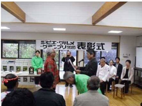
特別賞授与 出品料理:鹿肉のコンフィー 出店者:(有)たばこ屋商店