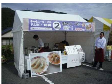
チャイニーズ・バル FARO/花楼