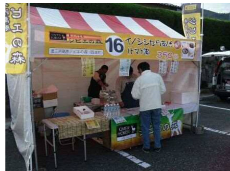
奥三河高原 ジビエの森