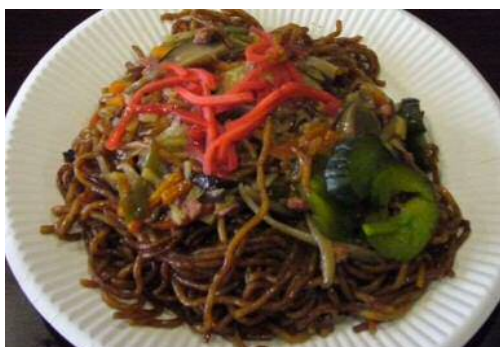
豊田あんかけ焼そば