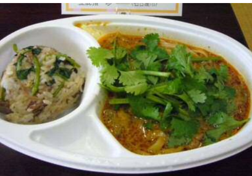
猪肉タイカレーまぜきしめん (追鹿にぎり付)