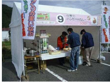
(株) どんぐりの里いなぶ