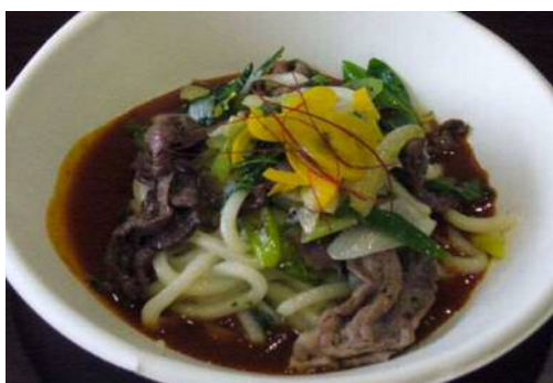
猪・鹿あんかけ南蛮うどん ミラカン風