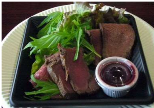
ロースト鹿肉を ブルーベリーソースで