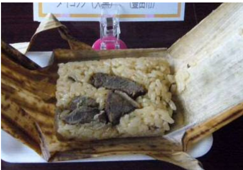
猪ちまき(おこわ風)