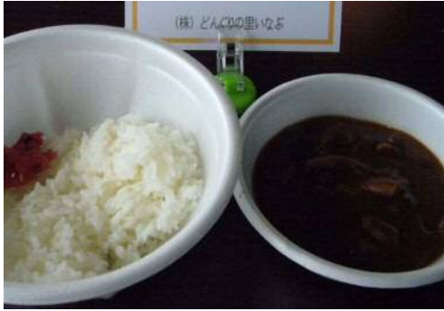
山家のバンビのカレー