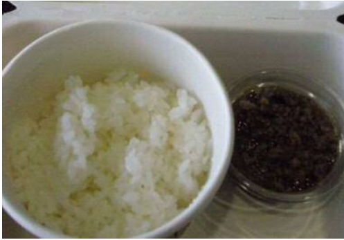
ご飯の友 猪肉そぼろジュレ