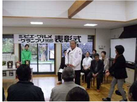
審査講評 全日本司厨士協会 東海地方本部会長