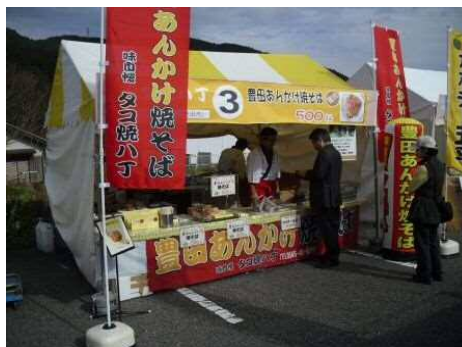
味自慢 タコ焼八丁