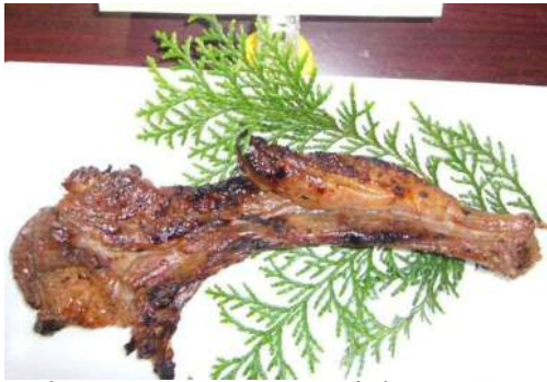
猪の和風カレーリブ炭火焼き