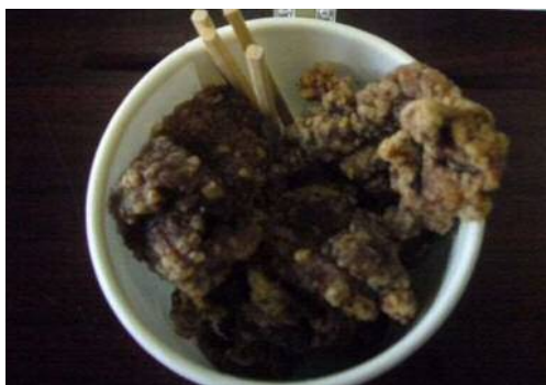
イノシシからあげ(トマト味)