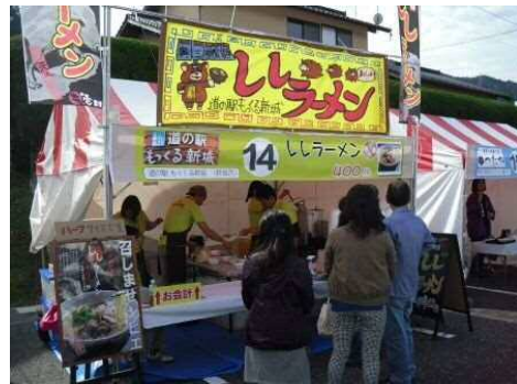
道の駅 もつくる新城