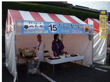
寿司と和食の店 つたや