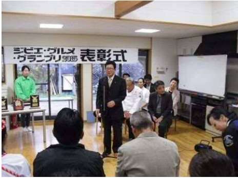
主催者あいさつ 愛知県農林水産部長