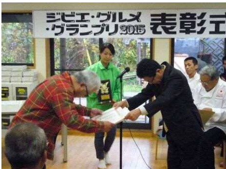
グランプリ授与 出品料理:鹿肉のコンフィー 出店者:(有)たばこ屋商店