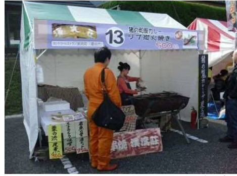
カントリーレストラン 溪流荘