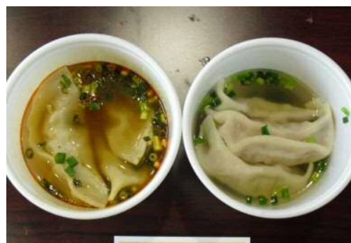
猪肉のスープ餃子 (酸辣湯・中華塩スープ)