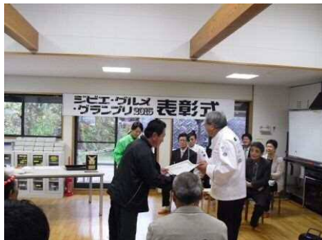
準グランプリ授与 出品料理:猪・鹿あんかけ 南蛮うどんミラカン風 出店者:食彩 阿蔵