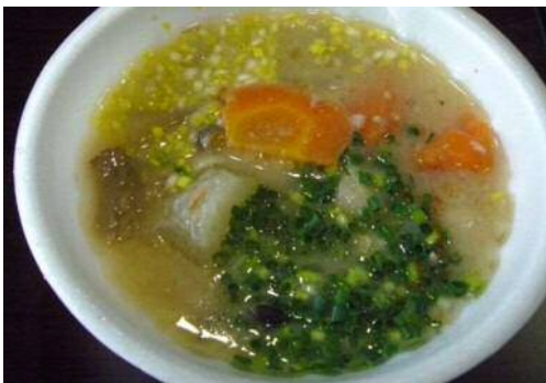
イノシシの酒かす鍋