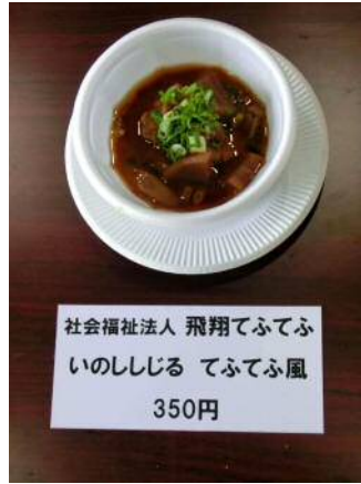
出品料理 いのしじる てふてふ風 350円