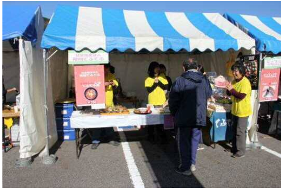
社会福祉法人 飛翔てふてふ 〔名古屋市天白区〕 初出店