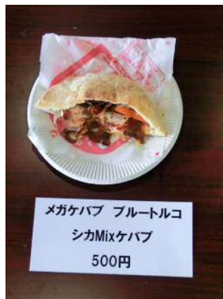
出品料理 メガケバブ ブルートルコ シカMixケバブ 500円