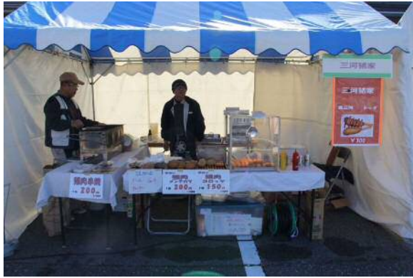
株式会社三河猪家