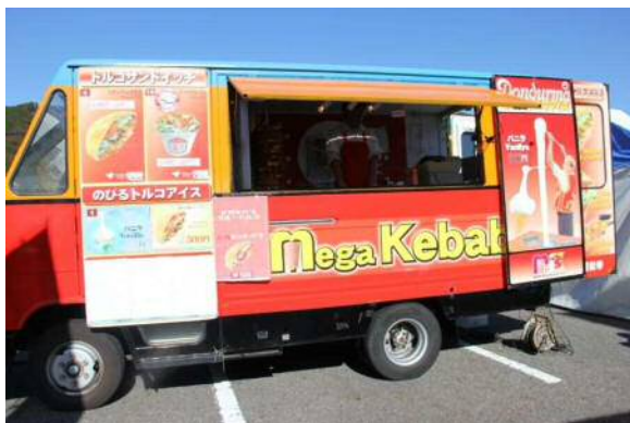
メガケバブ ブルートルコ 〔名古屋市熱田区〕 初出店