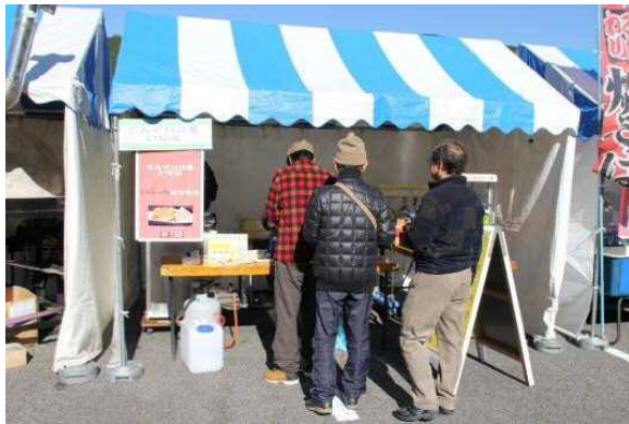
株式会社どんぐりの里いなぶ