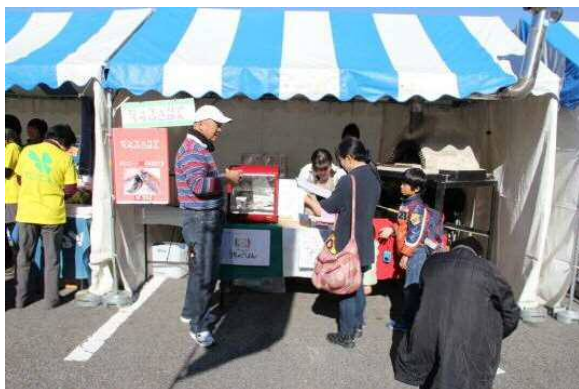
ピッツェリア うちのごはん