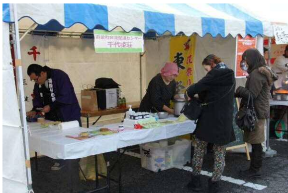
東栄町交流促進センター千代姫荘