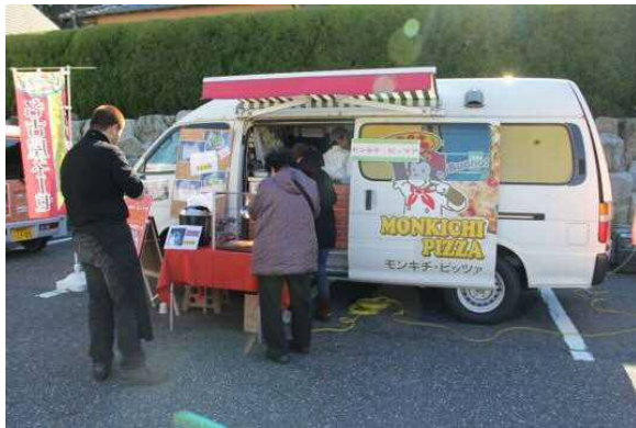
モンキチ・ピッツァ