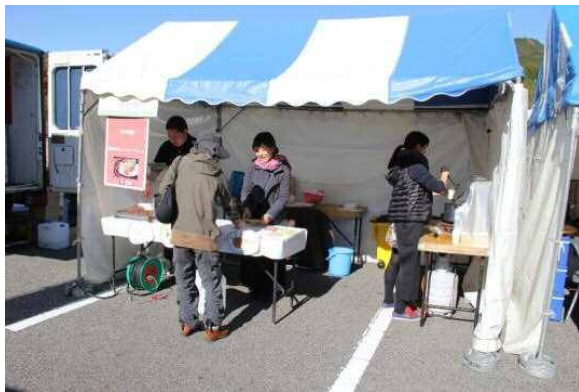
かが庵 〔豊田市〕 初出店