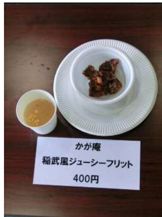
出品料理 かが庵 稲武風ジューシーフリット 400円