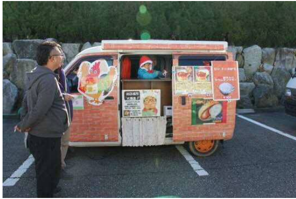
Sir. F☆PAP' s