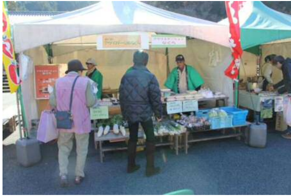
アグリステーションなぐら