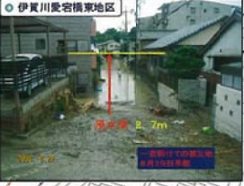
ゴムボートによる救出活動 伊賀川浸水橋東地区