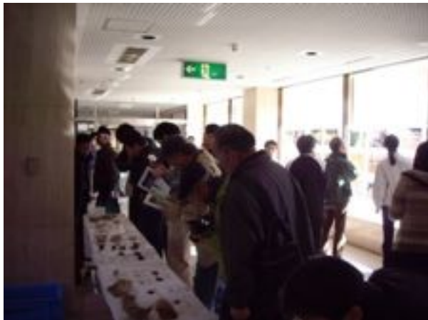
出土遺物の展示（下山交流館）

ということで 拓本体験 も行いました。成果報告会には43名、展示見学に92名、拓本体験に13名の方が参加見学していただき盛況の内に終了することができました。