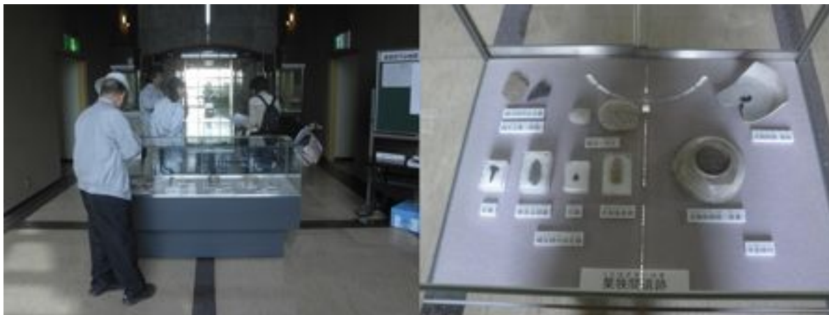
豊田市下山地区の遺跡出土遺物などの展示