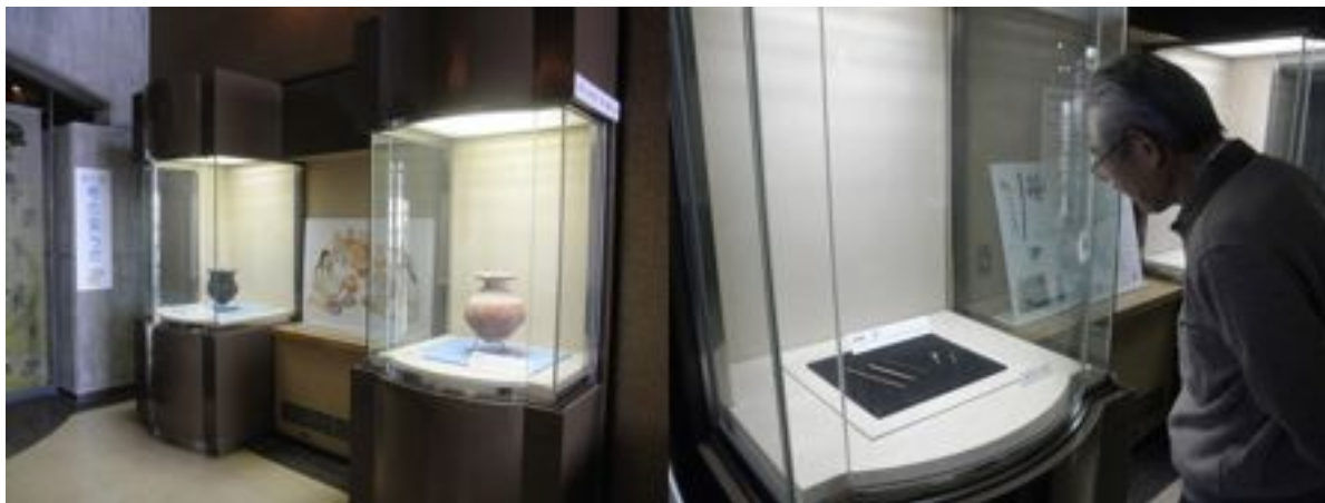
重要文化財 朝日遺跡出土品の展示