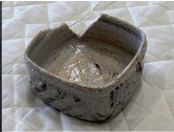
清洲城下町遺跡出土 志野向付（左右ともに）