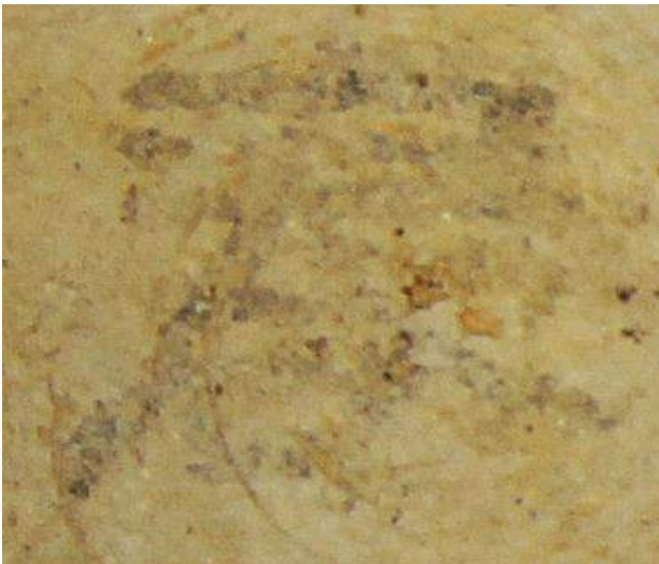
070S I 出土墨書土器拡大