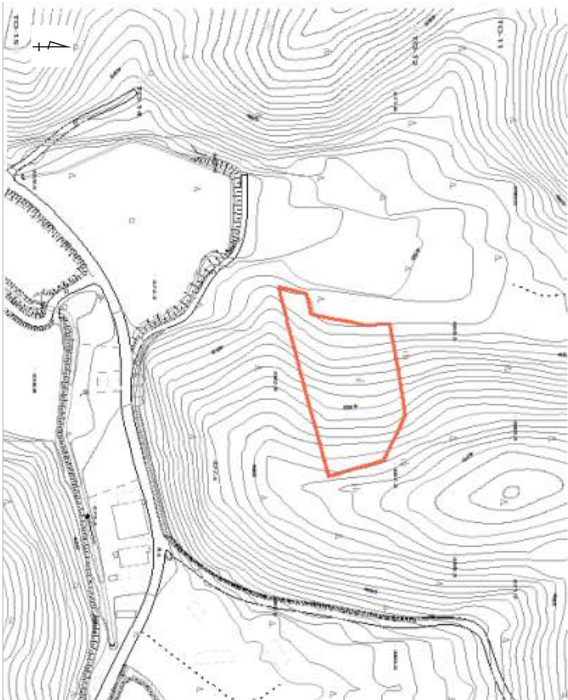
丸山遺跡調査区 1 : 1000