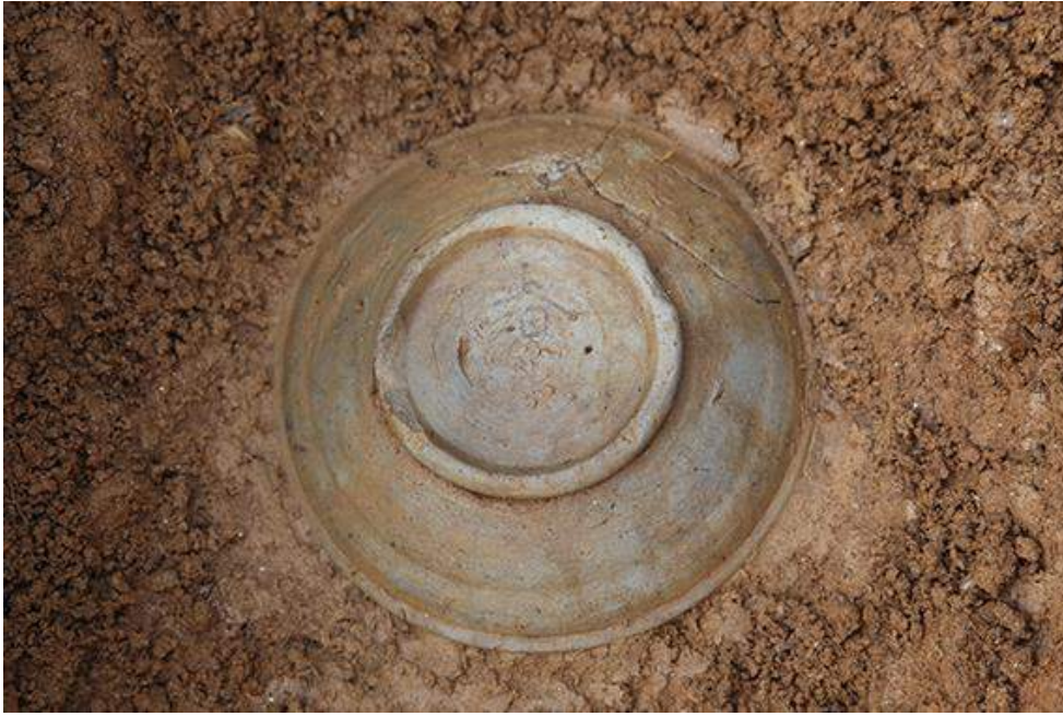
南北トレンチ墨書土器 出土状況