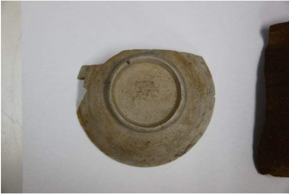
070S I 出土墨書土器