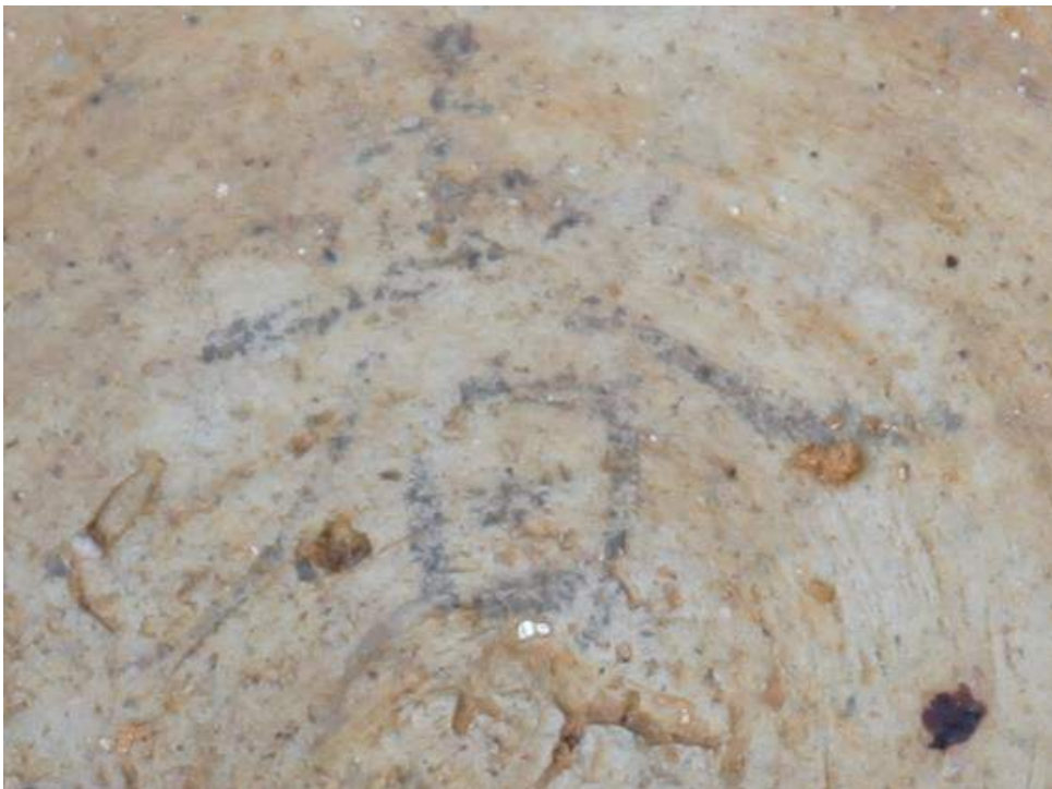
墨南北トレンチ出土墨書土器拡大