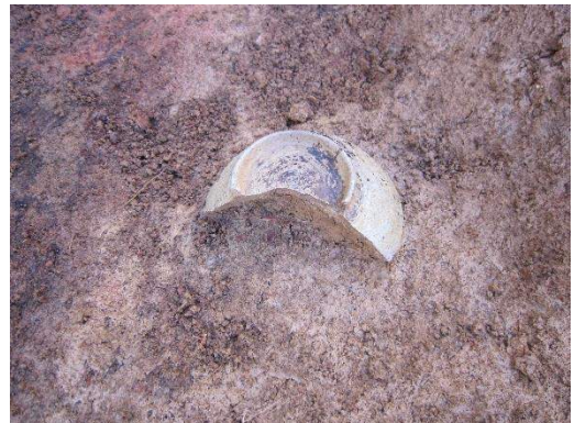
070SI 灰釉陶器出土状況