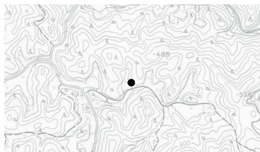
調査地点 (国土地理院 1/2.5 万地形図「東大沼」)

調査経過 豊田・岡崎地区研究開発施設用地造成に伴う事前調査として、愛知県企業庁より委託を受けて実施した。