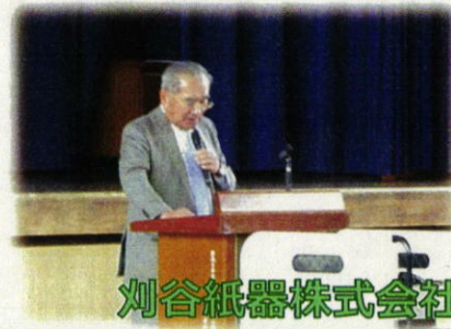
刈谷紙器株式会社 企業の方から学ぶ

自分たちが当たり前で生活できているのは、誰かが当たり前で環境を100%の仕事をしてつくっていることが分かりました。誰かの笑顔や幸せにつながるような仕事をしたいと思います。でも、私の今の生活は100%にはほど遠いです。今日の講習会から、勉強や部活、生活などで100%を目指してがんばっていきたいと思いました。