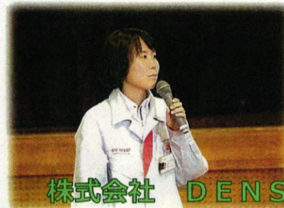
株式会社 DENSO 企業の方から学ぶ

苦労は多いけれど、好きな仕事ができることは幸せなことだと思いました。自分も将来、苦労も我慢できるような好きな仕事を見つけられるように、今から将来について考えていきたいです。