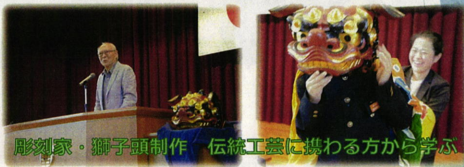
彫刻家・獅子頭制作 伝統工芸に携わる方から学ぶ