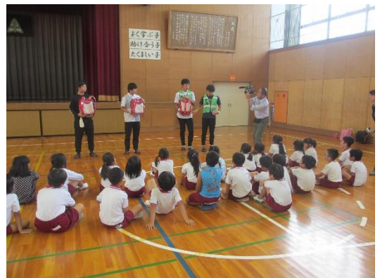
防犯ブザーの正しい使い方