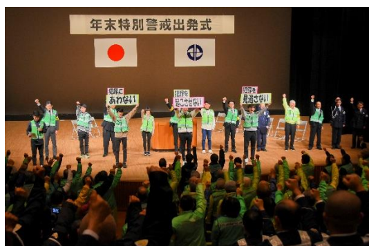
安全・安心宣言の様子

みよし市主催の年末特別警戒出発式にて、「安全・安心宣言」を実施し市内パトロール隊を激励し、防犯意識の高揚を図った。