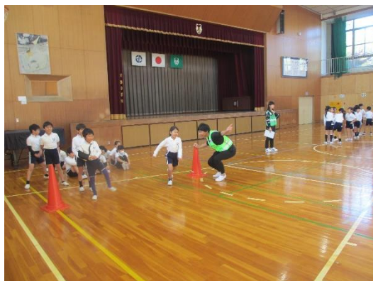
20メートルダッシュ