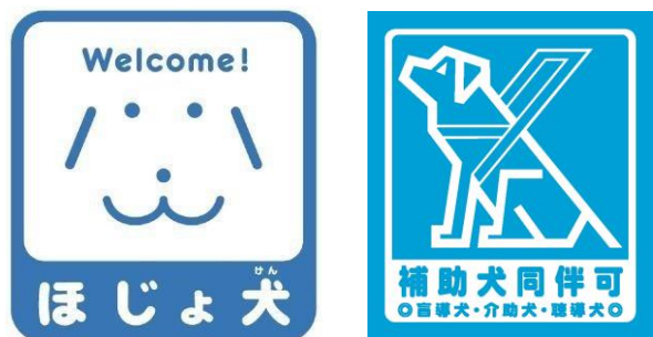
啓発ステッカーの例