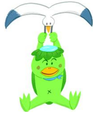
カッパの清吉とカモメのモン (愛知県海岸漂着物環境学習プログラム)

問 16 プラスチックごみ問題を悪化させないために、あなたは、今後どのようなことに取り組んでいきたいと思えますか。【○は複数可】