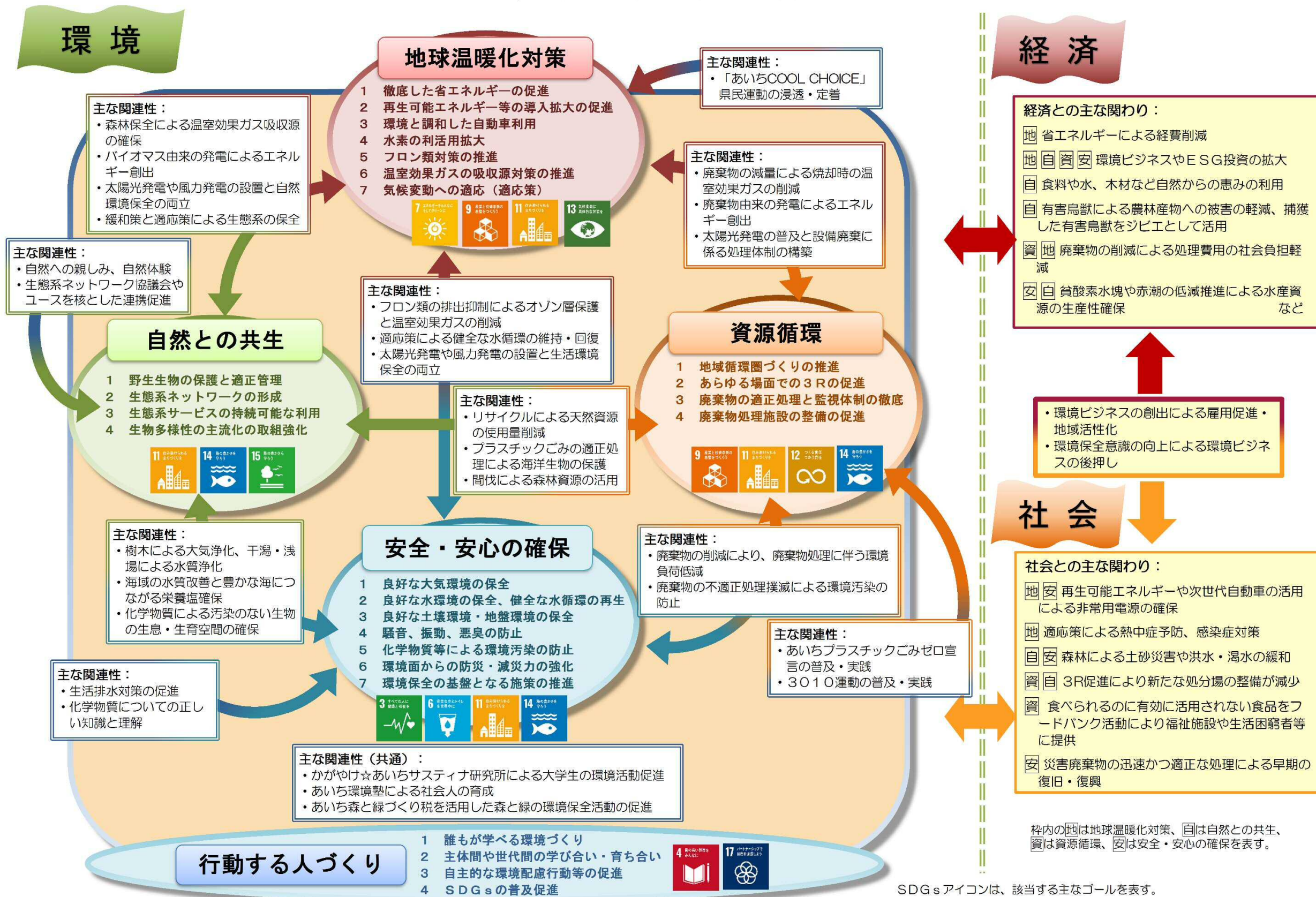
各取組分野の関連性と経済・社会との関わりのイメージ