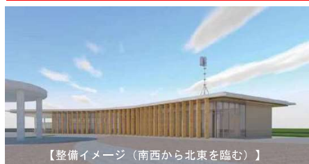
【整備イメージ（南西から北東を臨む）】