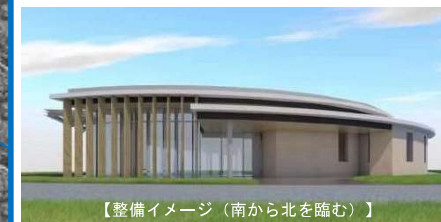
【整備イメージ（南から北を臨む）】