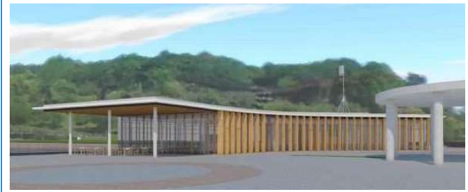
【西口案内所・休憩所の整備イメージ】

来園者が楽しく快適に滞在できるよう、公園西口の案内所・休憩所を建て替え、ジブリの大倉庫エリア付近には休憩所を新設するとともに、ジブリパークの各エリアをつなぐ園路を改修します。