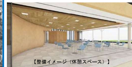
【整備イメージ（休憩スペース）】