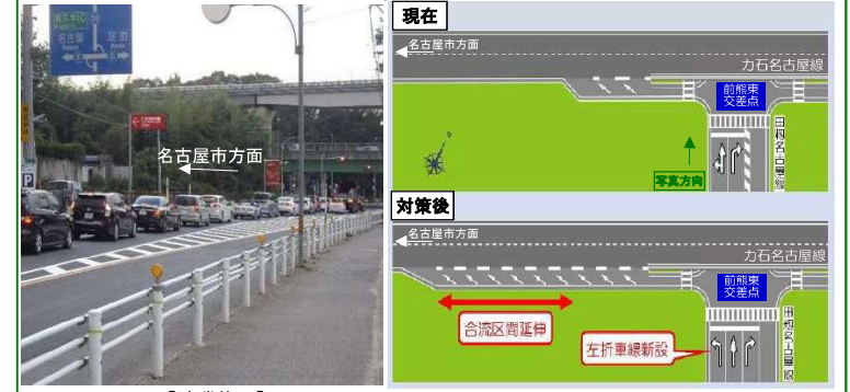
【渋滞状況】 <県道田柵名古屋線：前熊東交差点付近>

公園周辺の県道力石名古屋線や県道田柵名古屋線の交差点などにおける渋滞緩和に向けて、車線の追加や右左折車線の延伸などの工事を進めます。