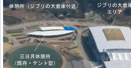
休憩所（ジブリの大倉庫付近） 三日月休憩所 （既存・テント型）