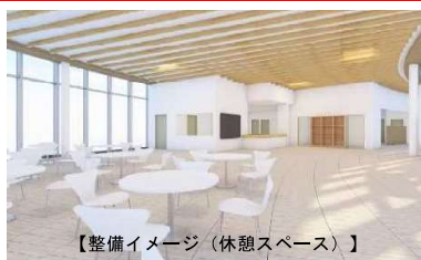
【整備イメージ（休憩スペース）】