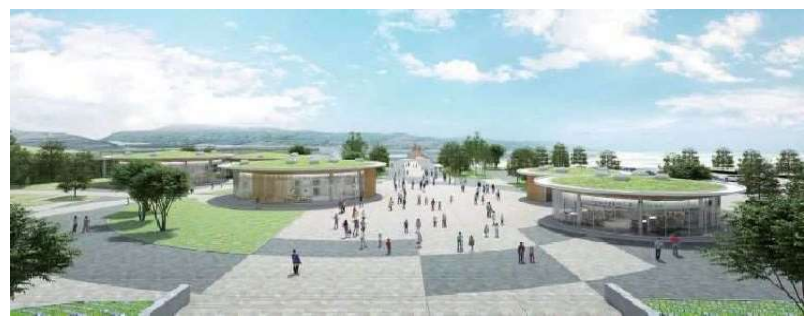
【北エントランスの整備イメージ（北から南を臨む）】

ジブリパークと調和した景観や公園の表玄関にふさわしい機能を備えた北エントランスの再整備を進めます。北エントランスには、案内所、休憩所、飲食及び物販などの機能を備えた総合案内センター（仮称）を設置します。 また、公園の北駐車場は入口の移設、供給処理施設の改修とあわせて駐車場の再整備を行います。