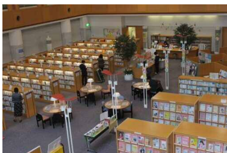
情報ライブラリー