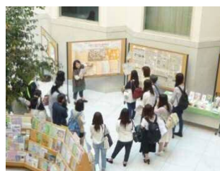
情報ライブラリー パネル展示風景