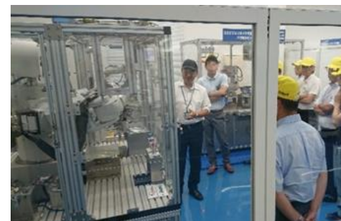
製造現場のデジタル化支援