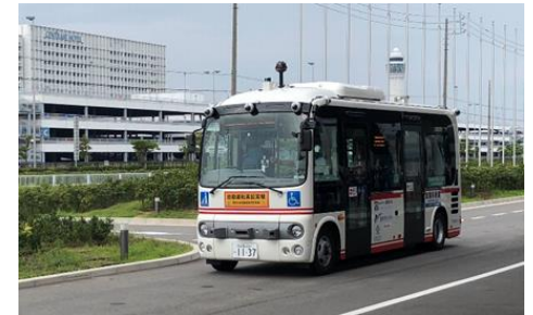
自動運転実証実験(中部国際空港島)