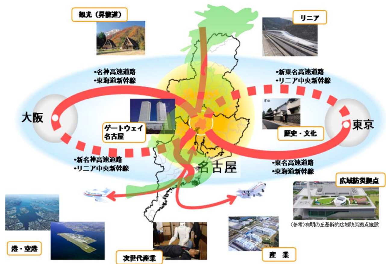
名古屋大都市圏の位置づけ（図①）

龍のイラストは、中部運輸局、北陸信越運輸局及び中部広域観光推進協議会が、中部北陸 9 県の自治体、観光関係団体、観光事業者等と協働して中部北陸圏の知名度向上を図り、主に中華圏からインバウンドを推進するために立ち上げた「昇龍道プロジェクト」のイメージを表している。「昇龍道」とは、中部北陸 9 県のエリアを総称する名称である。