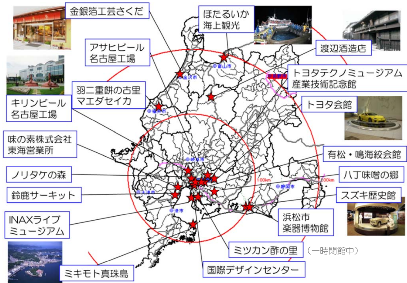
「昇龍道」プロジェクトの地域における主な産業観光資源の分布(図⑤)