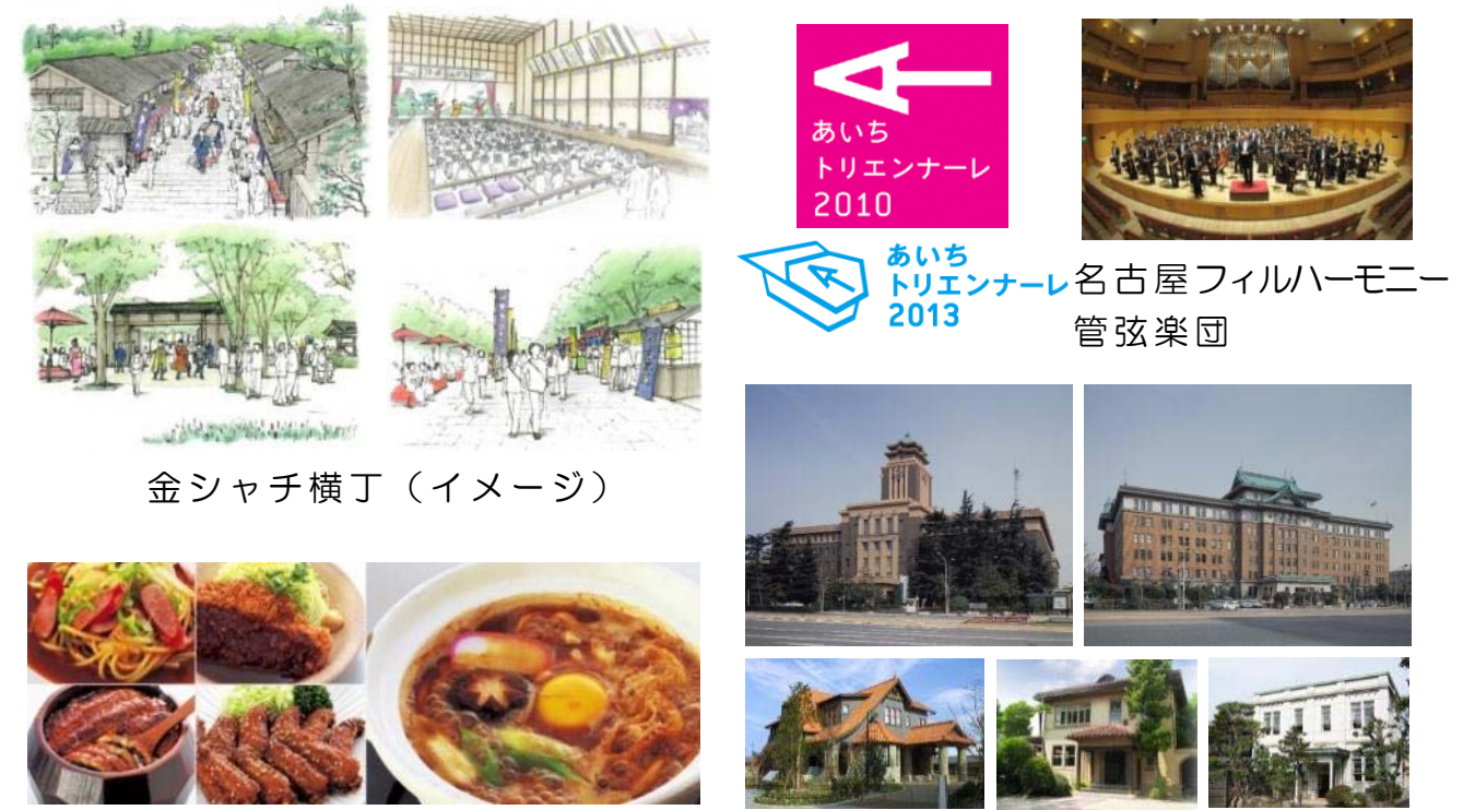
金シャチ横丁（イメージ）