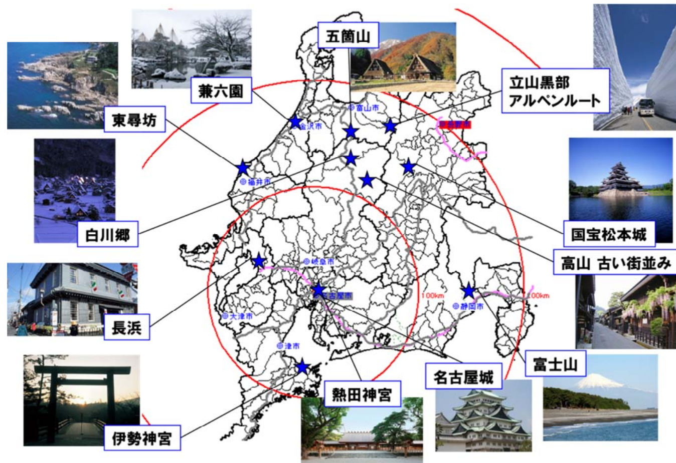
「昇龍道」プロジェクトの地域における主な観光資源等の分布(図④)