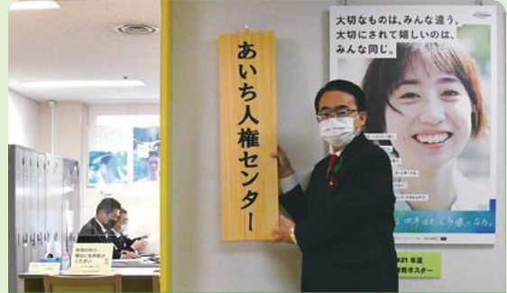
「あいち人権啓発プラザ」は、2022年4月から新たに「あいち人権センター」となりました