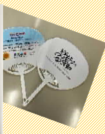
熱中症対策うちわ