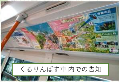
くるりんばす車内での告知