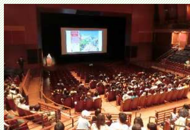
みんなでジブリ上映会プレトーク

また、参加者からジブリパークへの応援メッセージをボードに貼り付けてもらいました。参加料は小学校等へのジブリ関連書籍寄贈の費用に充てます。