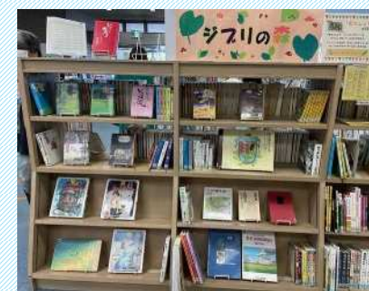
図書館ジブリ書籍コーナー