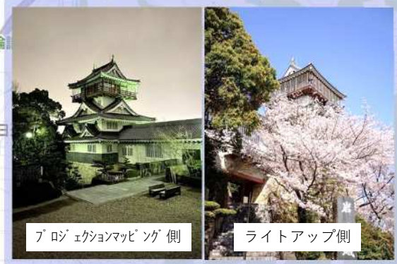
プロジェクションマッピング側