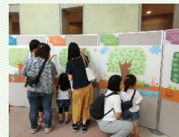
ジブリパーク応援メッセージボード