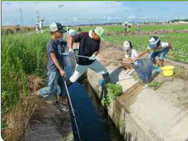
生き物調査【水土里豊かな北浜川西を創る会】