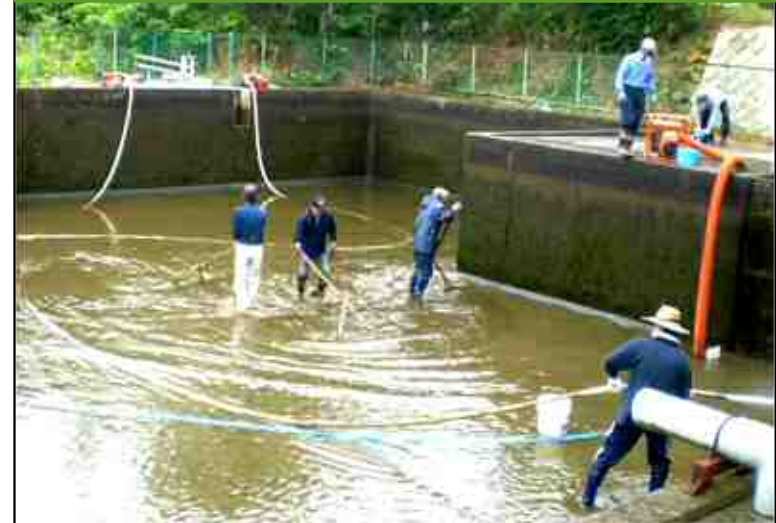
ファームポンドの泥上げ 【福江校区農地・水・環境保全組織】