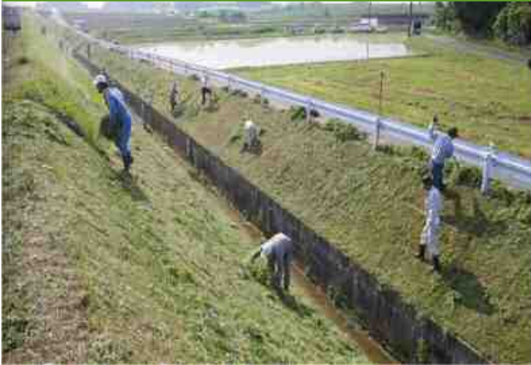
水路の草刈り【大興寺みどり保全会】