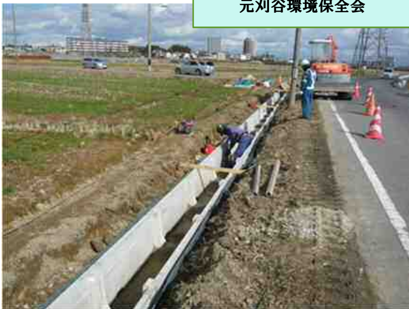
元刈谷環境保全会