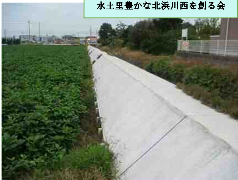
水土里豊かな北浜川西を創る会