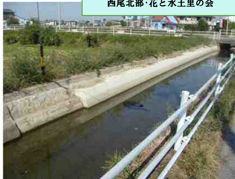
西尾北部・花と水土里の会