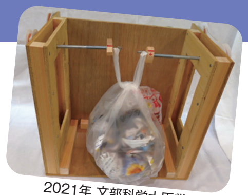
2021年 文部科学大臣賞 「かた手でくると結べます」